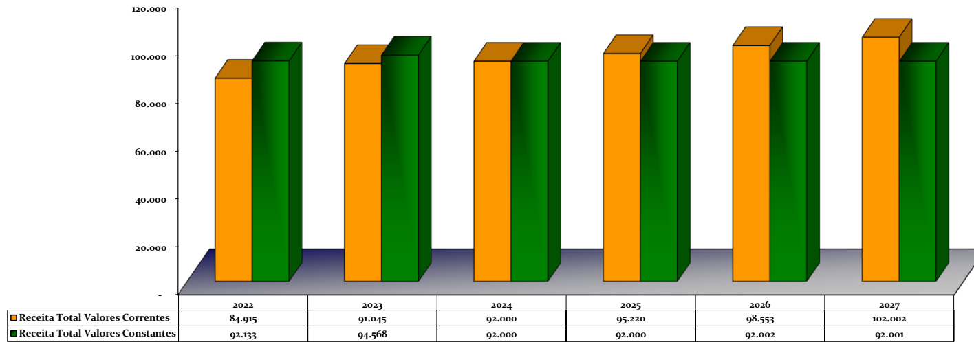
Valores Correntes x Valores Constantes