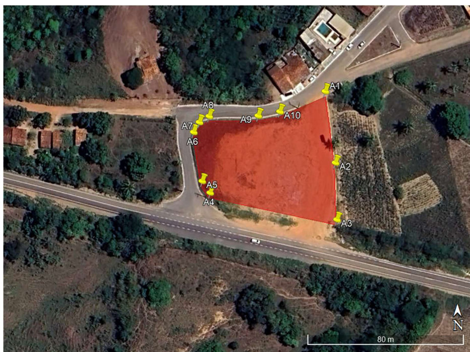
Figura 02: Área no Povoado Visgueiro em Muribeca/SE.