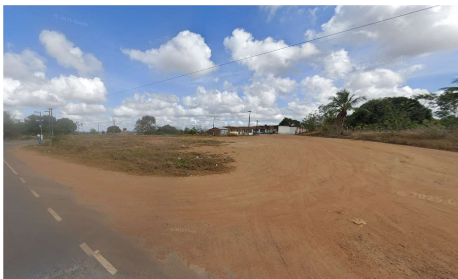
Figura 03: Registro fotográfico da área no Povoado Visgueiro em Muribeca/SE.

Documento assinado digitalmente gov.br LEANDRO DE ASSIS FERREIRA Data: 03/12/2025 14:29:23-0300 Verifique em https://validar.iti.gov.br