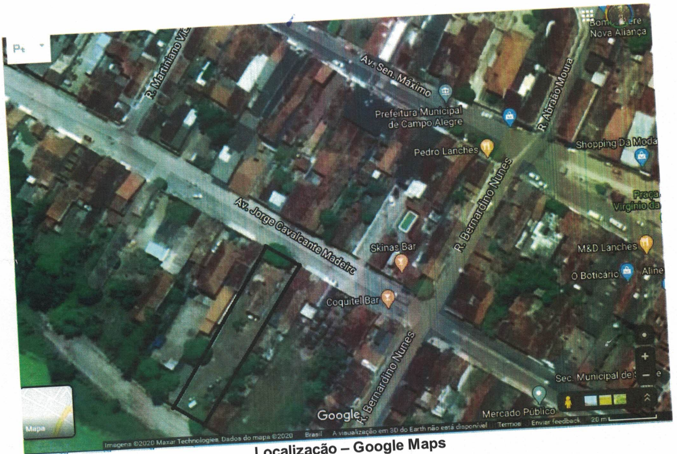
Localização – Google Maps

Rua Senador Máximo, Nº 35 – 1º andar – Centro – CEP: 57.250-000 – Campo Alegre/AL FONE: 3275-1505/1606 - CNPJ: 12.264.628/0001-83