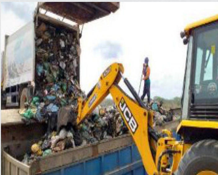
DESCARGA E COMPACTAÇÃO

No transbordo local, os resíduos são descarregados na carreta, é enlonamento e transportado para o (CTRA) de Craíbas/AL onde acontece a destinação final.