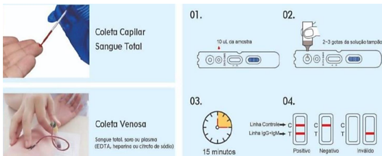
Figura 2 - Esquema de realização do teste rápido Wondfo (SARS-CoV-2 Antibody Test) (COVID-19) IgG/IgM

O resultado é verificado após 15 minutos da realização do teste. Mais informações sobre a sua execução estão disponíveis na instrução de uso em site do fabricante no vídeo instrucional a ser disponibilizado no site do MS, no link www.saude.gov.br/coronavirus .