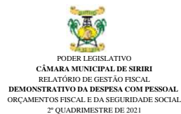
Tabela 1 - Demonstrativo da Despesa com Pessoal - Estados, DF e Municípios RGF - ANEXO I (LRF, art. 55, inciso I, alínea "a")