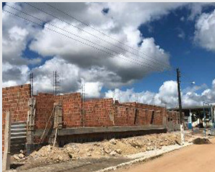
Figura 7 - Centro de Apoio a Inclusão Escolar – CAIE