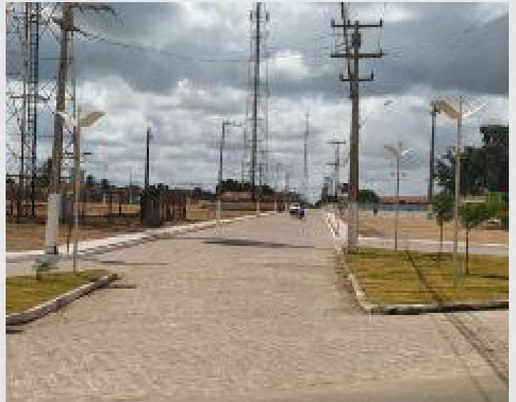
Figura 28 - Bairro Benedito de Lyra – Avenida dos Atletas