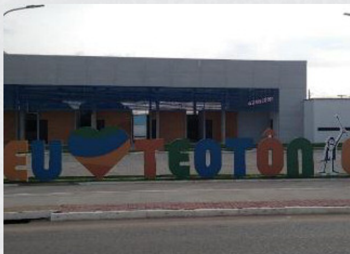
Figura 23 - Empório do Menestrel