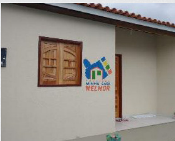
Figura 19 - Povoado Água de Meninos