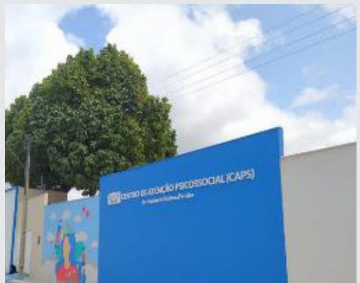
Figura 10 - Centro de Atenção Psicossocial - CAPS - Bairro Centro