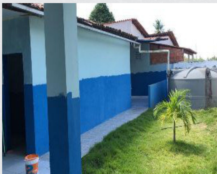
Figura 6 - E.M.E.B. Odilon Floriano