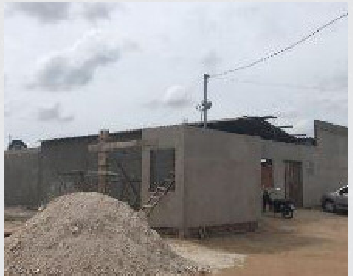
Figura 26 - Complexo das Secretarias