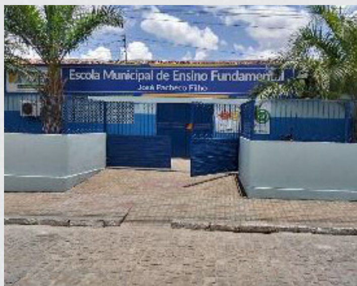
Figura 2 - E.M.E.F. José Pacheco Filho.