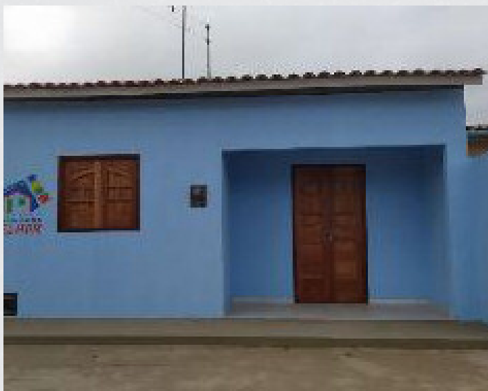
Figura 17 - Conjunto José Quincas