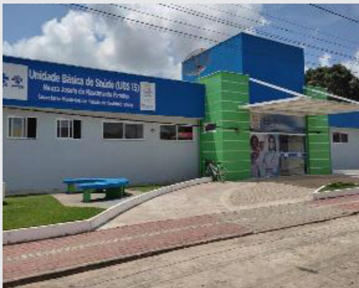
Figura 13 - UBS 15 (Neuzia Josefa Belarmino)