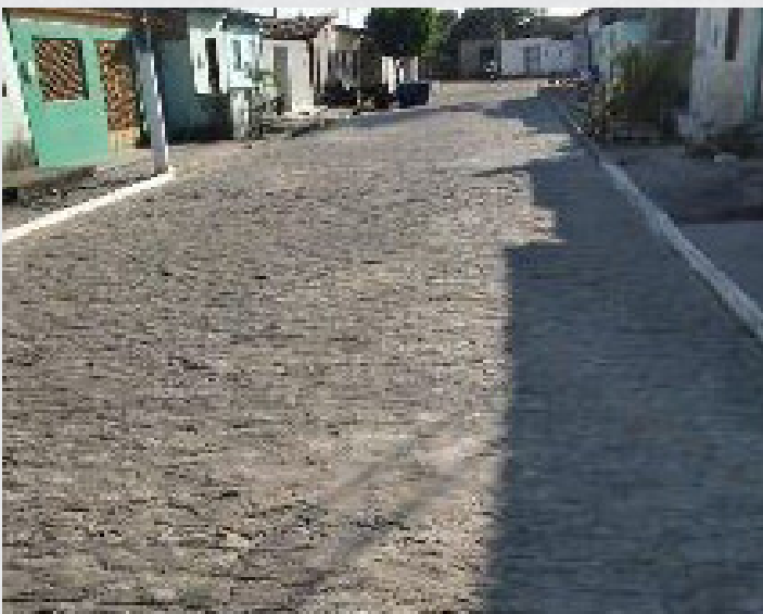
Figura 29 - Bairro São Jorge / Rua Artur Macedo