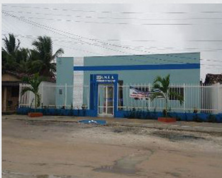
Figura 3 - E.M.E.B. Roberto Magno