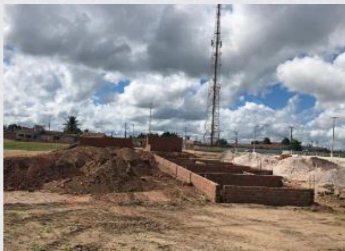
Figura 24 - Parque Santuário Nossa Senhora de Guadalupe