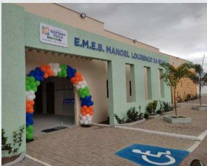
Figura 5 – E.M.E.B. Manoel Lourenço Da Silva