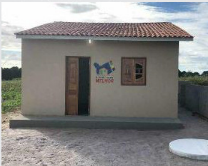
Figura 15 - Bairro Gerais – Conj. José Eudes)