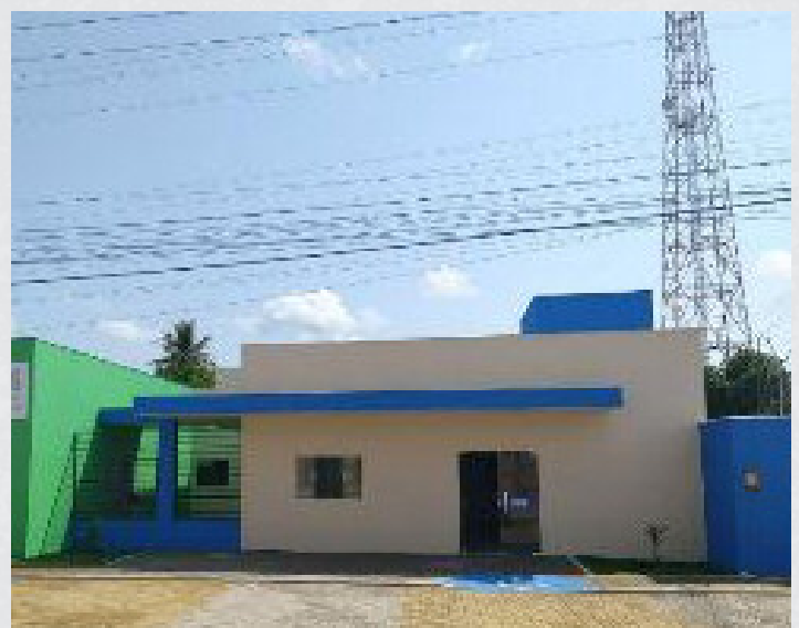
Figura 12 - UBS 13 (José Belarmino)