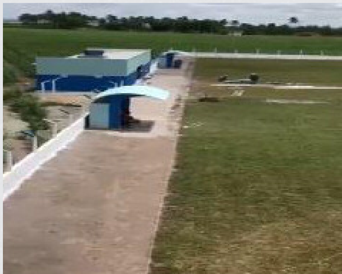
Figura 22 - Campo Esportivo do Povoado Matão do Roberto