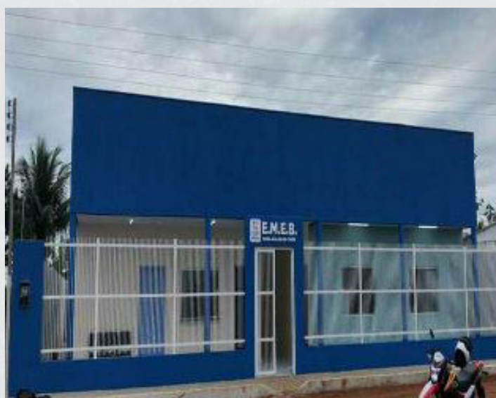
Figura 4 - E.M.E.B. Mª Idalina Da Costa