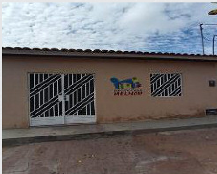
Figura 18 – Bairro Sebastião Vilela