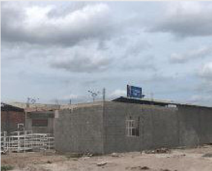
Figura 25 - Complexo das Secretarias