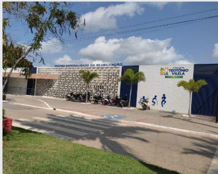
Figura 8 -Centro de Reabilitação (CER) Bairro Centro