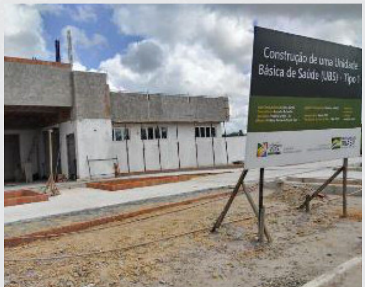
Figura 14 - UBS 08 - Distrito Gulandim / em andamento Bairro Centro