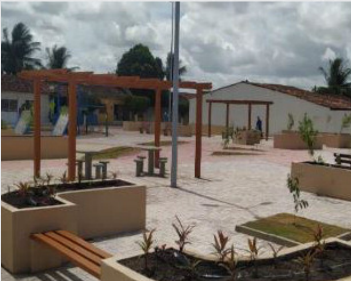
Figura 27 – Bairro Miguel Felizardo Praça Vereador Sandoval Vieira da Silva