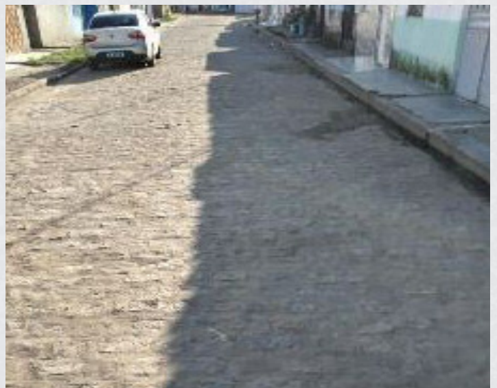
Figura 30 - Bairro São Jorge / Rua Prof. Joel Ferreira