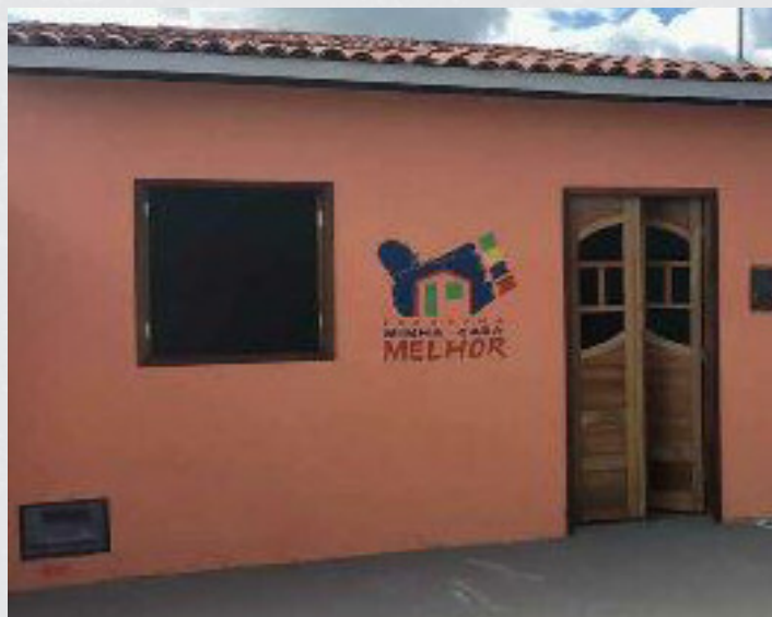
Figura 16 - Rua Francisco Natividade Costa - Bairro Centro