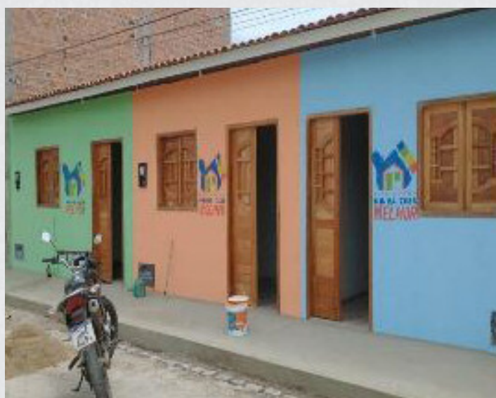
Figura 20 - Rua Manoel Pedro da Silva (Rua da Beré) - Bairro Centro