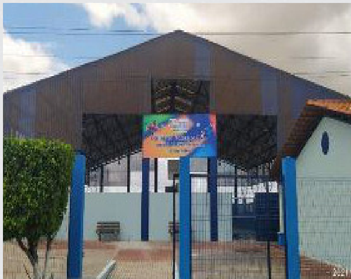
Figura 21 - Ginásio Poliesportiva Agnaldo Macêdo dos Santos – (Agnaldão)