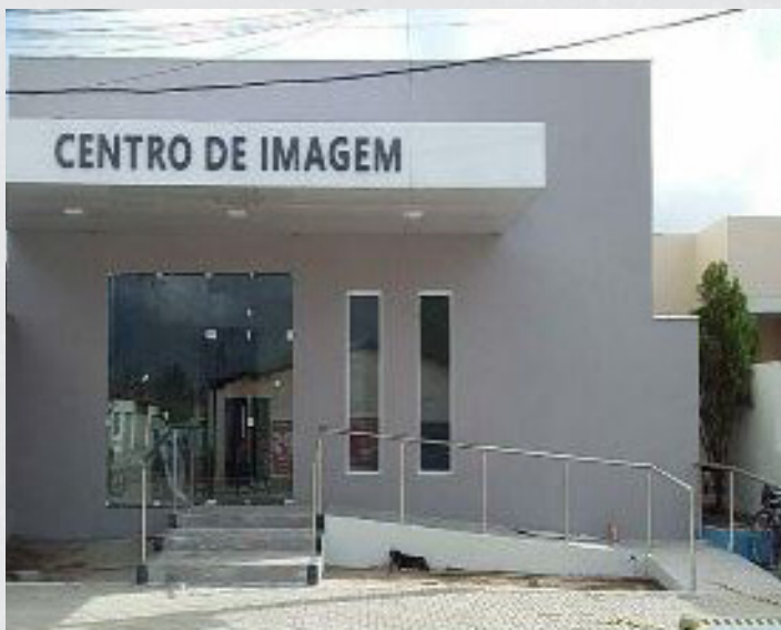
Figura 9 - Centro de Imagem - Bairro Centro