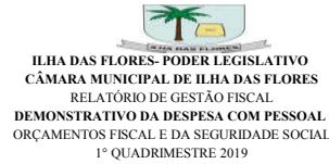
Tabela 1 - Demonstrativo da Despesa com Pessoal - Estados, DF, Municípios

RGF - ANEXO 1 (LRF, art. 55, inciso I, alínea "a")